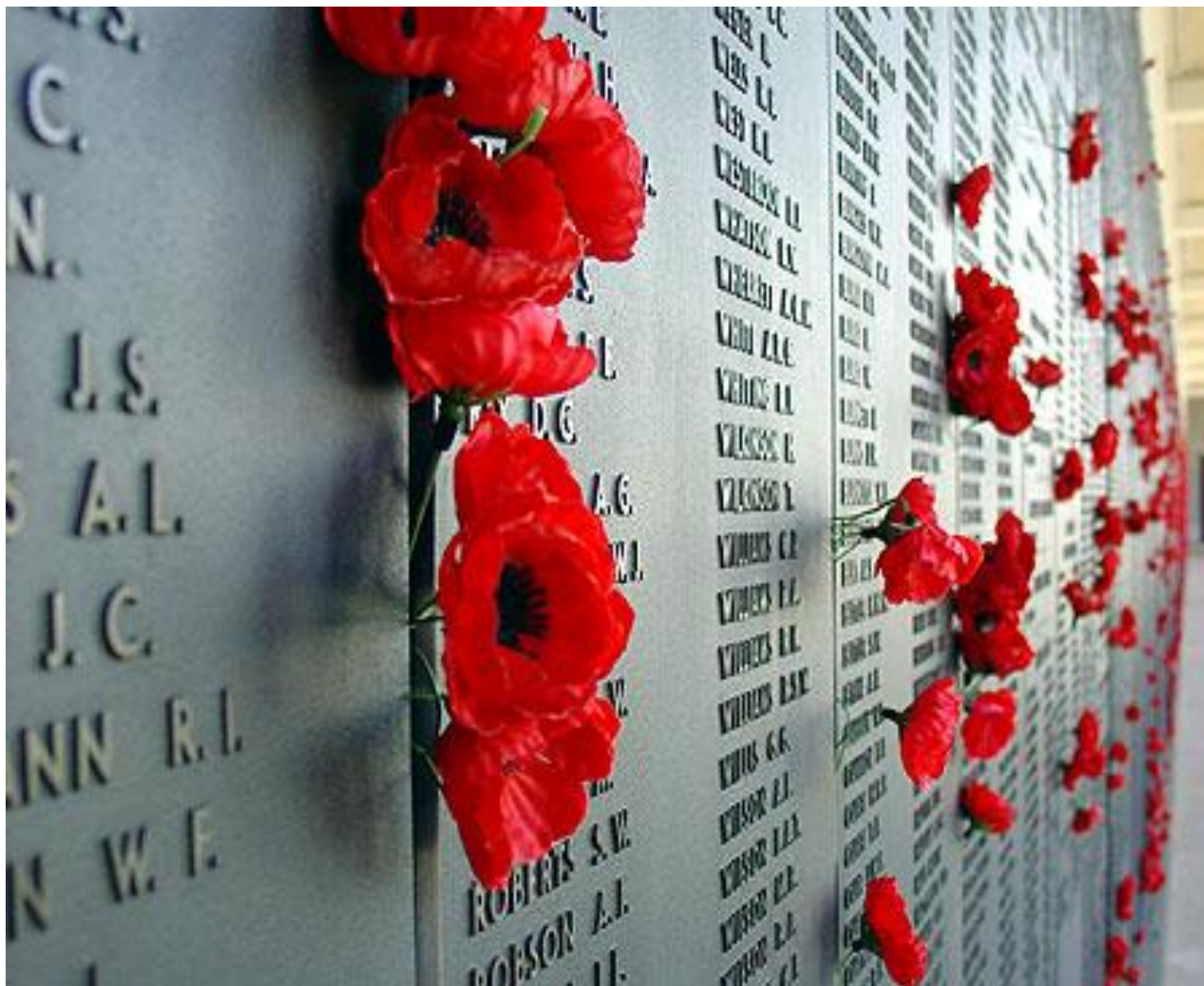
Roll of Honour a Camberra

I papaveri adornano i pannelli del “ Roll of Honour ” che si trova a Canberra. I fiori vengono messi affianco ai nomi dei caduti per rendere omaggio alle migliaia di soldati qui commemorati.