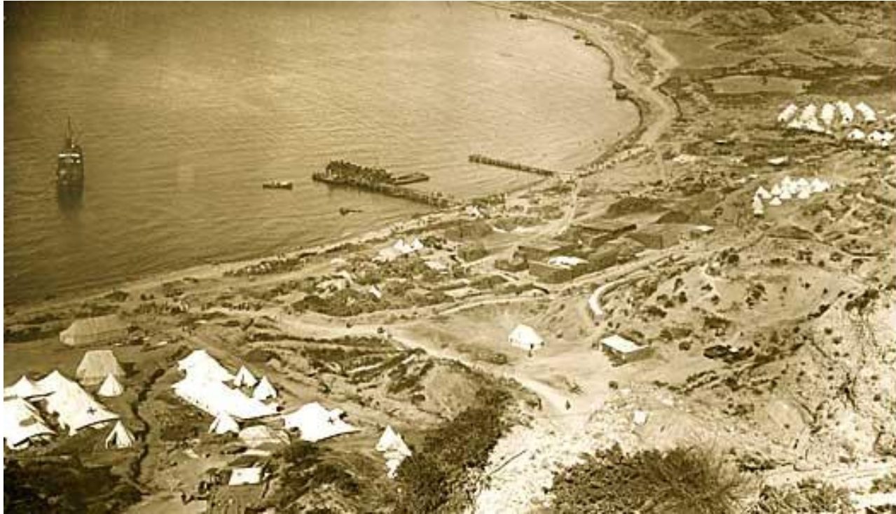
North Beach, Anzac

Il 25 Aprile é la festa nazionale australiana piú importante.