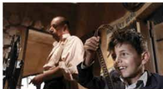
24 settembre Nuovo cinema paradiso