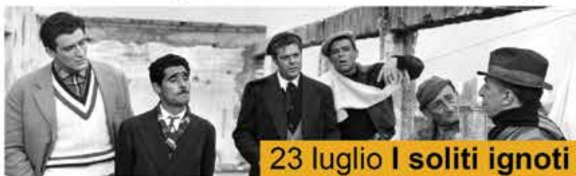
23 luglio I soliti ignoti