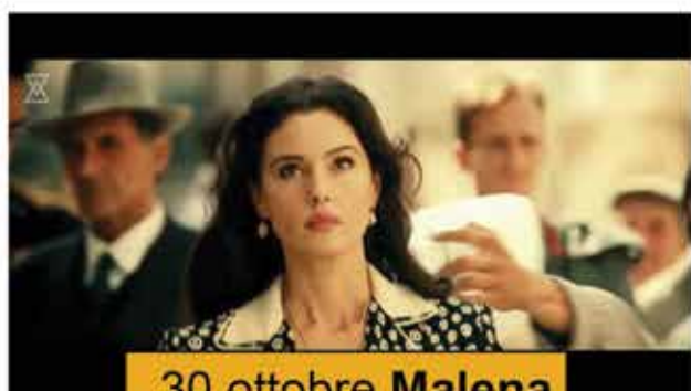
30 ottobre Malena