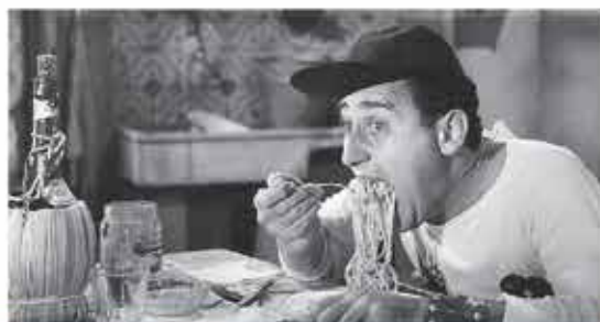
14 agosto Un americano a Roma