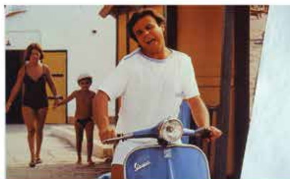
26 novembre Sapore di mare