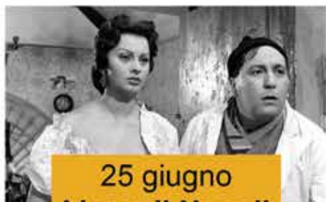
25 giugno L'oro di Napoli